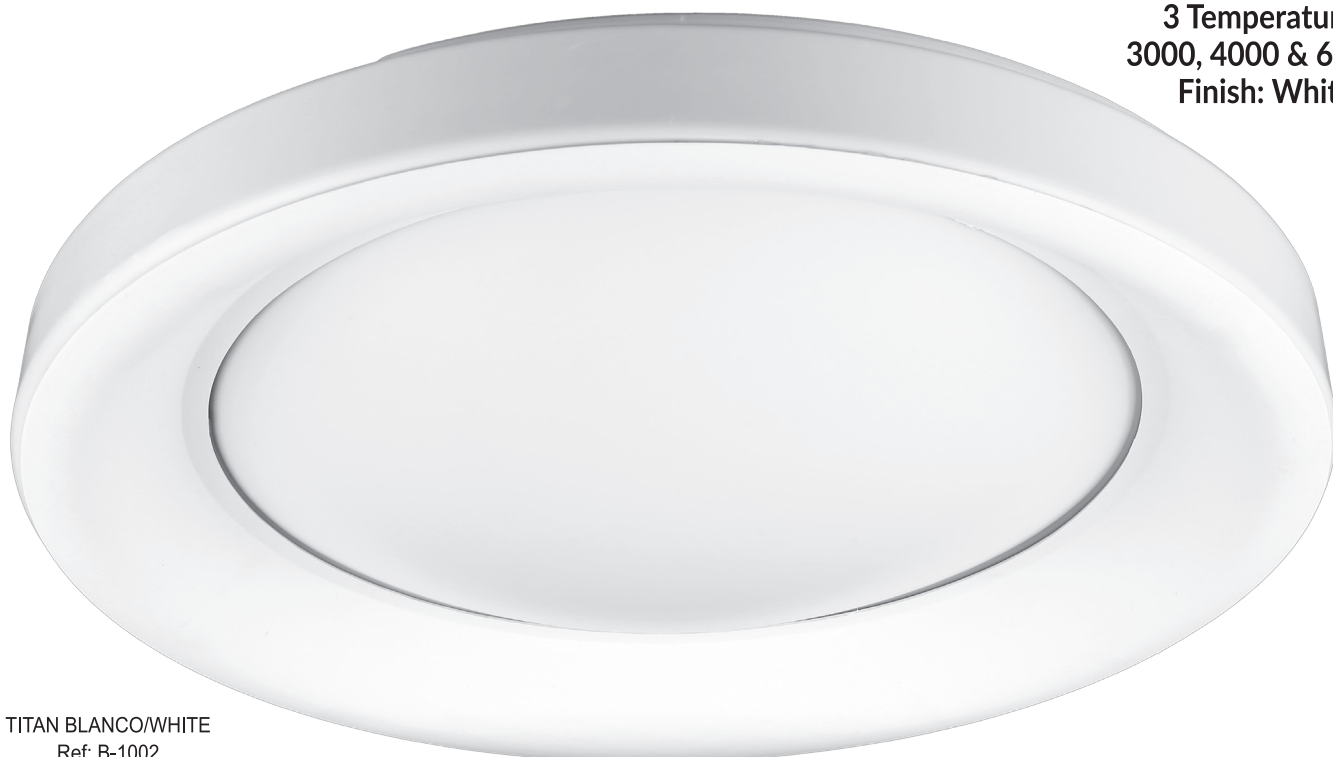
TITAN BLANCO/WHITE Ref: B-1002

36W 3 Temperatures 3000, 4000 & 6500K Finish: White