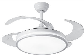
REF: B-1006 FINISH: BLANCO/WHITE