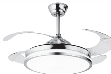
REF: B-1007 FINISH: NIQUEL/NICKEL