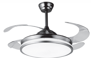
REF: B-1008 FINISH: CUERO/ANTIC BRASS