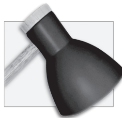
GREY/GRIS - REF. W-1209