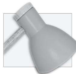
PINK/ROSA - REF. W-1200