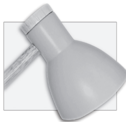
BLUE/AZUL - REF. W-1208