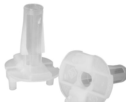
TRAVA FIOS BRANCO