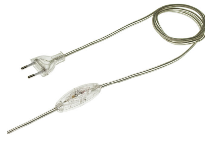
EXTENSÃO ELÉTRICA TRANSPARENTE