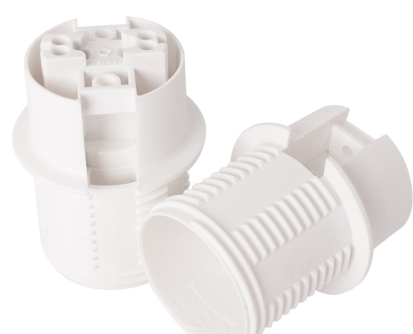
SUPORTE CASQUILHO BRANCO