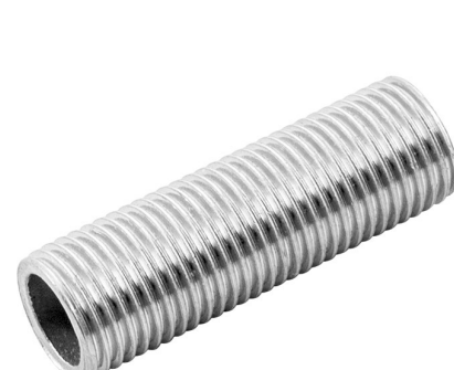
TUBO ROSCADO ZINCADO