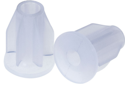
ADAPTADOR DE GARRAFAS BRANCO