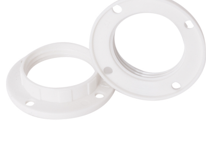
ANILHA DE ABAT-JOUR BRANCO