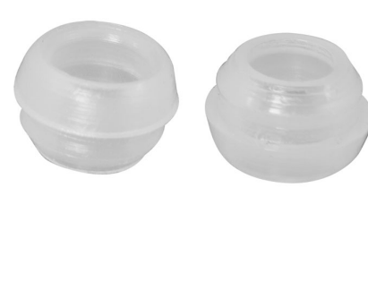
PASSA FIOS TRANSPARENTE