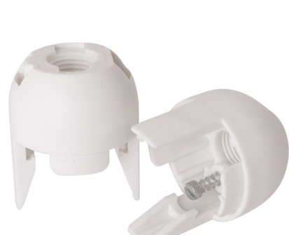
CAPA CASQUILHO BRANCO